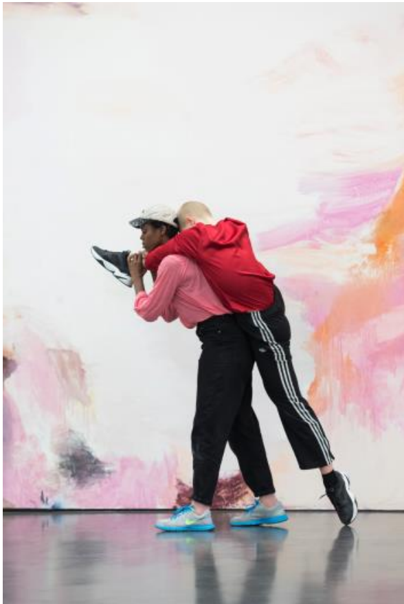
Megan Rooney, Performance Every Been There , 2019, Kunsthalle Düsseldorf