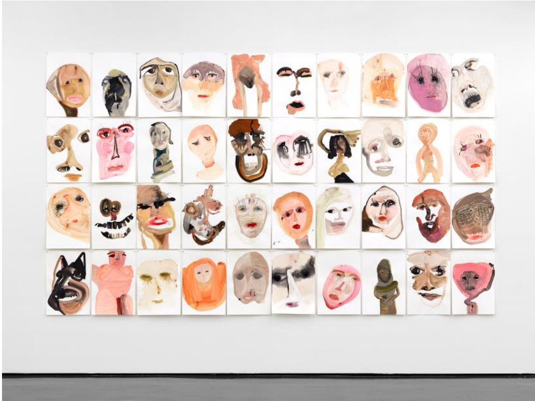
Megan Rooney, Fire on the Mountain , 2019, Kunsthalle Düsseldorf.