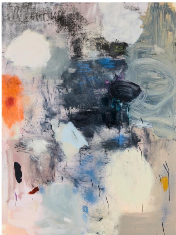
Megan Rooney, Origin City , 2019, Kunsthalle Düsseldorf