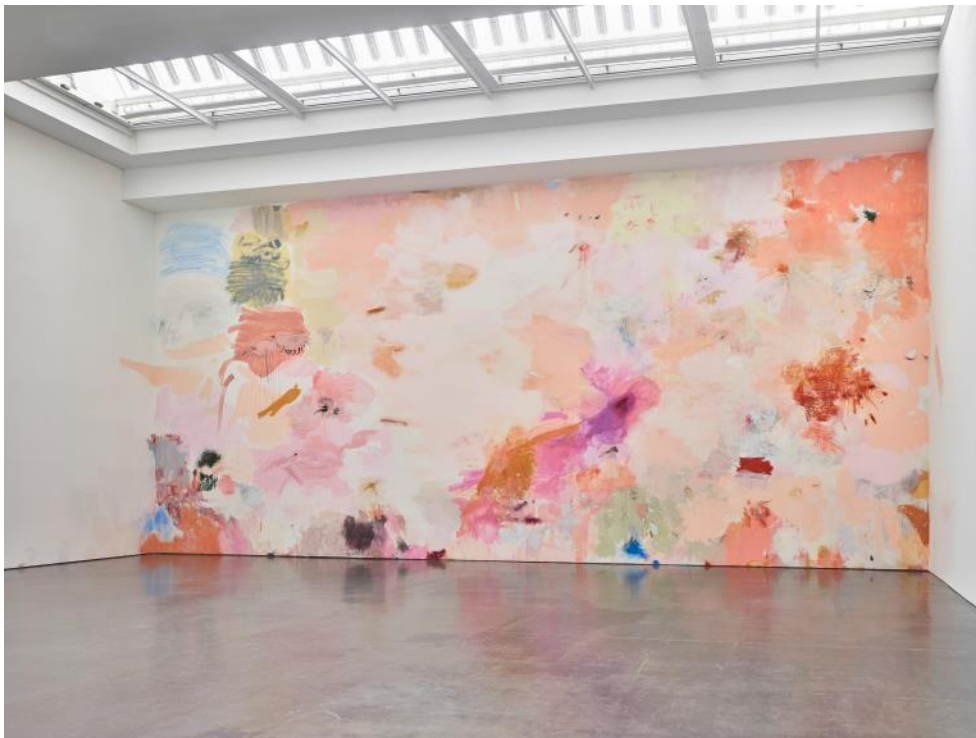
Megan Rooney, Fire on the Mountain , 2019, Kunsthalle Düsseldorf.

https://www.serpentinegalleries.org/whats-on/park-nights-2018-megan-rooney-sun-down-moon