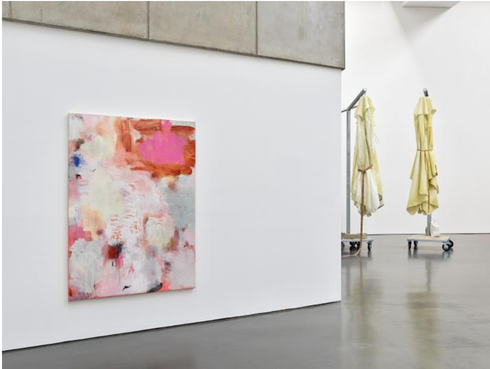
Megan Rooney, Fire on the Mountain , 2019, Kunsthalle Düsseldorf. Courtesy the artist and DREI, Köln. Foto: © Achim Kukulies